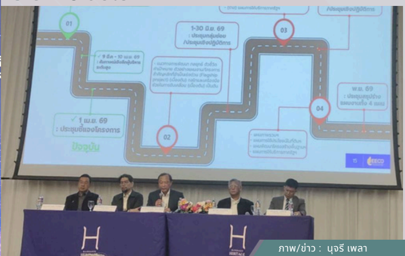
ภาพ/ข่าว : นุจรี เพลา เรียบเรียง : ปิ่นจรัส ไทยเจริญ