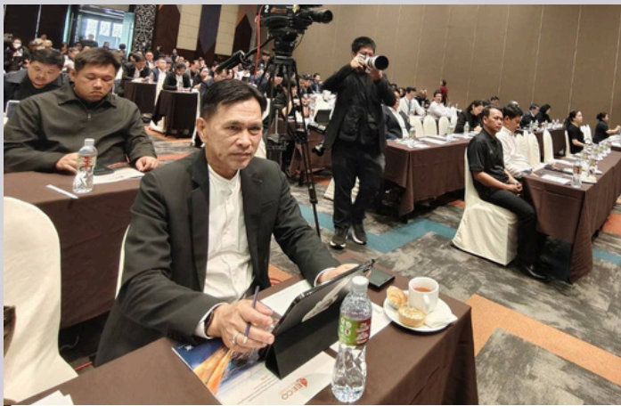
แผน EEC คือ แผนระดับไหน .... ?