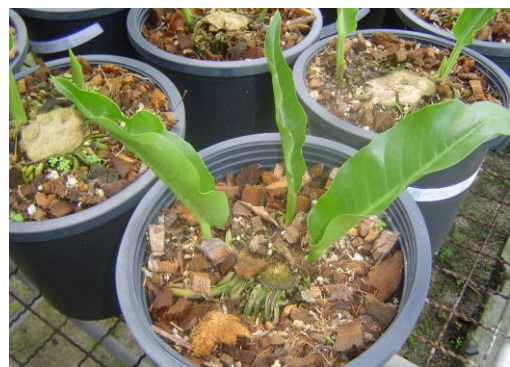
หลังจากปักชำแล้วคอยดูแลรักษาให้น้ำพอประมาณคือไม่แฉะจนเกินไป อายุ 10-15 วัน จะมีการเริ่มแตกของหน่อขึ้นมา ท่อนพันธุ์บางกระถางอาจจะมี 2-5 หน่อ แตกขึ้นมาสามารถที่จะแยกฝ่าหน่อออกมาชำในกระถางใหม่ได้ ปฏิบัติดูแลรักษา จนกระทั่งมีใบ 3-5 ใบ ก็สามารถนำไปปลูกลงแปลงได้