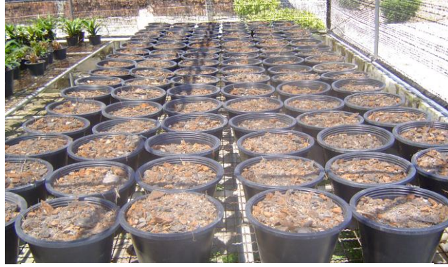
กระถางใส่วัสดุ สำหรับที่จะนำส่วนของลำ ต้นมาชำ วัสดุที่ใช้ควรจะร่วนโปร่งระบายน้ำดี